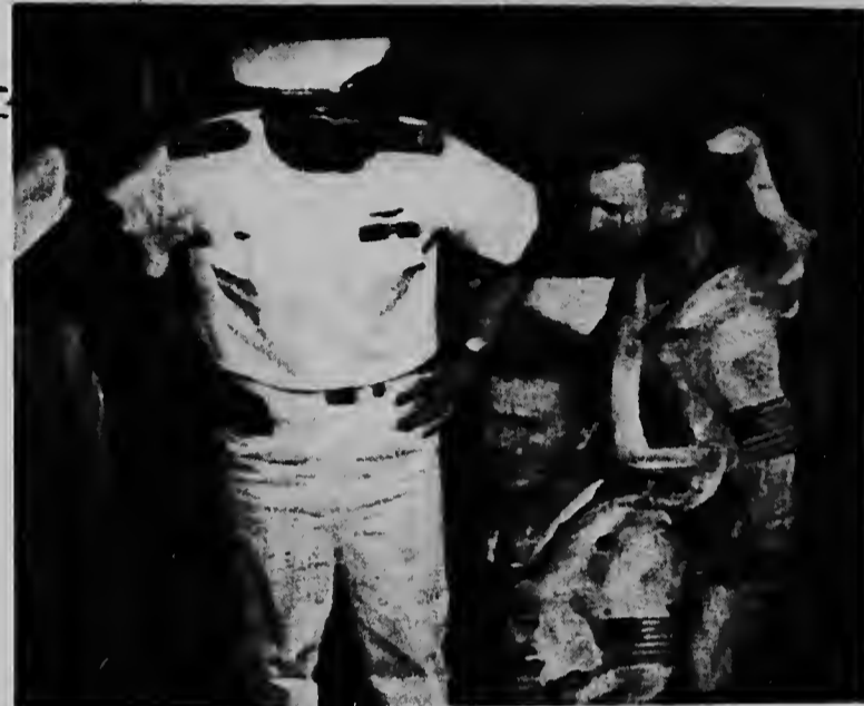
Frank Borman y James Lovell ta sinta banda di otro den helicopter despues qu nan a coge nan for di den laman - foto arriba-. Riba e foto abao por mtra oficialnan di e bapor Wasp ta ricibi nan.